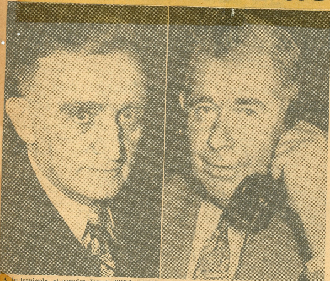
A la izquierda, el senador Joseph O'Mahoney (demócrata de Wyoming) quien dirigió la batalla en favor de la Constitución. A la derecha, el senador