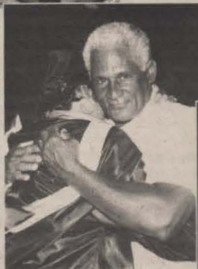
Momentos emotivos pudieron ser captados durante la colación de grados del Recinto de Guayama.