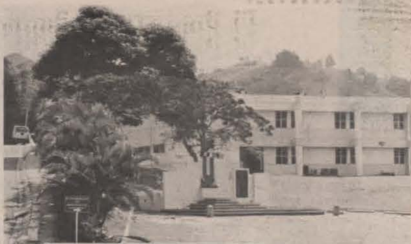
Edificio Nuevo y Plaza de la Esperanza, en el Recinto de Barranquitas.

Si se tiene una organización en proceso de aprendizaje continuo, en la que los empleados han pasado por una transformación personal, se mejorarán las relaciones con los clientes, aumentará el patrocinio, mejorará la colaboración entre los departamentos, se fortalecerá el trabajo en equipo y se eliminarán algunos costos innecesarios; en fin, esta transformación personal será el pasaporte al Siglo XXI.