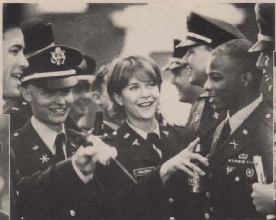
Denzel Washington interpreta el rol del Teniente Coronel Nathaniel Serling, en la película "Courage Under Fire".

La joven actriz, Meg Ryan (al centro) interpreta el papel de la capitana Karen Walden en la película "Courage Under Fire".