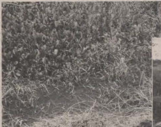
Las especies de eneas, lechugas acuáticas y los jacintos de agua han invadido el 90% de la superficie de la Laguna, resultando en pérdida de hábitat.

El CECIA en colaboración con la Fundación Gabriella y Paul Rosenbaum han sido instrumentales en el desarrollo de los trabajos del Comité. Desde hace varios años la UIPR, con el auspicio de la Fundación, realiza labor investigativa en el área de la