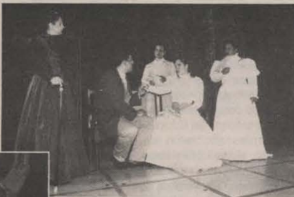
Representación de "Cuando las flores de pascua son de azar" durante la puesta en escena de "Burundanga", en el Teatro La Perla, en Ponce.

El grupo, el cual este año cumple su séptimo aniversario, se nutre de jóvenes de diferentes facultades que no poseen estudios previos en teatro. El taller está constituido por jóvenes estudiantes de diferentes disciplinas: biología, química, humanidades y administración de empresas.