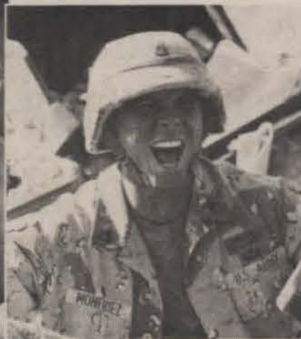
Lou Diamond Phillips en el rol del soldado "Monfriez" en el filme "Courage Under fire".

¿Se merecen los premios, verdaderamente, aquellos que tan sonrientemente los reciben, año tras año? ¿Somos tan fuertes como para sobreponernos a presiones, tales como las que acosaron al Teniente Coronel Nathaniel Serling para que hiciese una pseudo-investigación, con resultados sabidos de antemano, para complacer —en el caso de la película— a la Casa Blanca y al Pentágono?