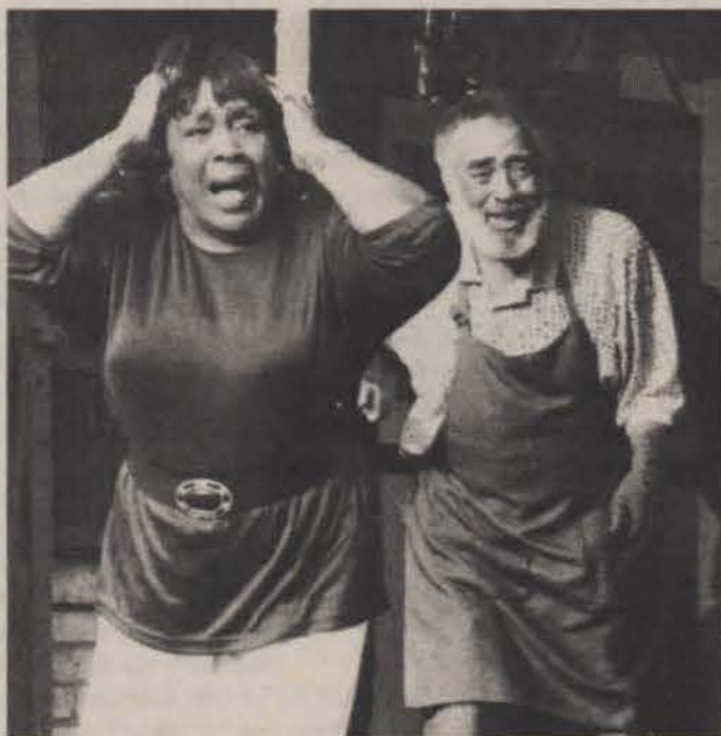
Fred Williamson y Pam Grier deciden tomar la ley en sus manos en una escena clave de la película "Original Gangstas".

El argumento de ésta gira en torno a cómo un pequeño pueblo, sin recursos, se enfrenta al problema de las pandillas que roban y matan sin piedad. La acción se desarrolla lejos de las grandes ciudades como Nueva York y San Juan para llamar la atención a la universalidad del problema. Es posible que el realismo de las escenas de violencia atemorizen algunos de los espectadores porque cada vez son más intensas, y en una serie infinita, sin aparente esperanza de salvación. Pero, aquí ocurre la parte más interesante, y en cierto sentido, inesperada. Los buenos residentes de aquella población, finalmente podrán resolver el problema, pero no puede decirse como lo logran, porque se echaría