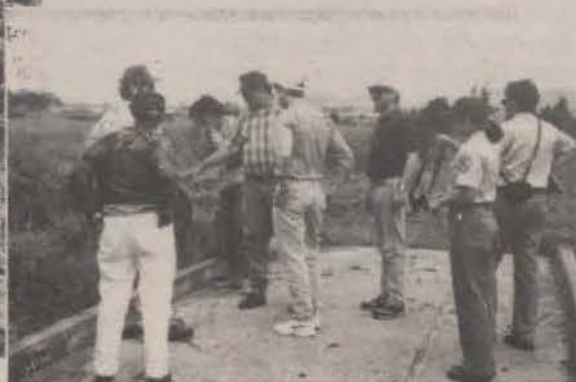
En la foto, personal del CECIA y del Servicio de Pesca y Vida Silvestre realiza una visita a la Laguna Cartagena con los representantes del Congreso y de la Fundación Gabriella y Paul Rosenbaum.

Laguna Cartagena coleccionando datos que han servido de base al desarrollo de los planes para la restauración. El CECIA ha logrado también interesar al sector privado. Por ejemplo, la compañía farmacéutica Johnson & Johnson aportó para la construcción de una estructura para muestreos de sedimentos en el lugar.