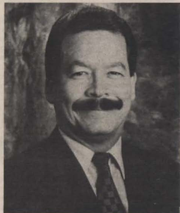
Prof. Ángel A. Rivera, vicepresidente ejecutivo de la Universidad Interamericana de Puerto Rico.

incidentales y generales (infraestructura, mantenimiento y construcción) en un 25%; el costo a nivel de maestría aumentó a $10.00 por horas-crédito para este año académico 96-97 y $5.00 por horas-crédito para los dos años subsiguientes. En el caso del programa graduado a nivel doctoral el aumento será de $15.00 por horas-crédito solamente en este año.