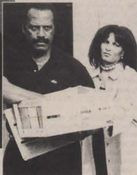
Isabel Sanford y Oscar Brown, Jr. en una escena de mucho impacto emocional de la película "Original Gangstas".

a perder el atractivo de esta película. Una cosa se puede anticipar: resuelven el problema sin la ayuda de la Policía. Cuando la Policía llega, ya los valientes ciudadanos habían resuelto el problema.