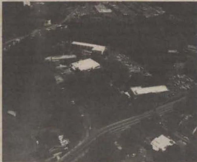
Vista aérea del Recinto de Barranquitas

La UIPR celebró los actos de graduación de sus respectivas unidades en un ambiente de júbilo y mensajes de altura, acorde con los cambios sociales y las necesidades de los estudiantes de hoy.