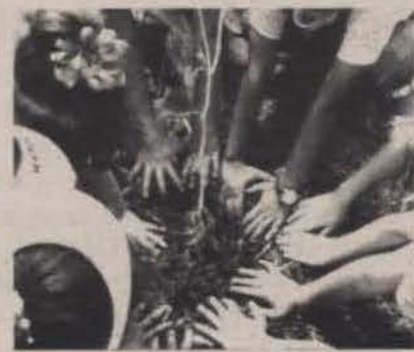
Niños del Centro Pre Escolar se prestan a sembrar uno de los nueve árboles en el área recreativa de dicho centro.

Por otro lado, durante la clausura de la Semana del Planeta Tierra (mes de abril) cada división académica representada por su decano, adoptó un árbol del Recinto. La coordinación entre los estudiantes de Ciencias Biológicas y el profesor Torres, fue esencial para la rotulación de estos árboles durante dicha semana. [Por Margarita Segarra Resto, oficial de Relaciones Públicas del Recinto Metropolitano de la UIPR].